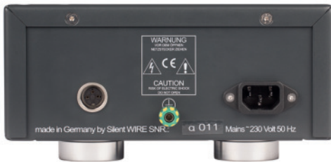
- Netzteil / Power Supply -