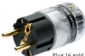
Plug 16 gold