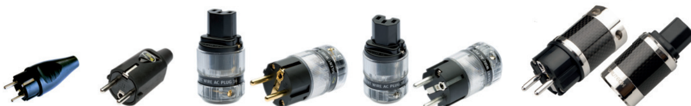
Standard Stromstecker SERIE 6 Stromstecker SERIE 16 AC Plug gold SERIE 38 AC Plug silber Furutech FI-E50 (R) / FI-50 (R)

Silent WIRE Netzkabel werden serienmäßig mit folgenden Steckern konfektioniert: Silent WIRE powercords will be delivered with the following plugs as standard: