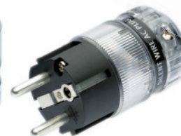
Plug 38 Ag