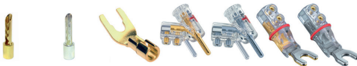
SERIE 16 Crimbanane SERIE 38 Crimbanane SERIE 16 Kabelschuh WBT 0610 Cu WBT 0610 Ag WBT 0661 / 0681 Cu WBT 0661 / 0681 Ag

Silent WIRE LS-Kabel werden serienmäßig mit folgenden Steckern konfektioniert: Silent WIRE speaker cables will be delivered with the following plugs as standard: