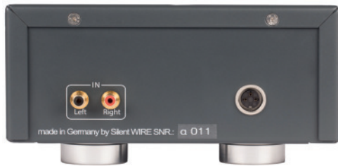
- Verstärker / Amplifier -