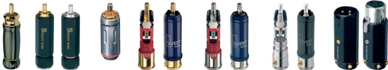
SERIE 4 Cinch SERIE 16 Cinch SERIE 38 Cinch Furutech 162G WBT 0110 Cu WBT 0110 Ag WBT 0152 Ag Furutech FP-601 R

Silent WIRE NF-Kabel werden serienmäßig mit folgenden Steckern konfektioniert: Silent WIRE interconnects will be delivered with the following plugs as standard: